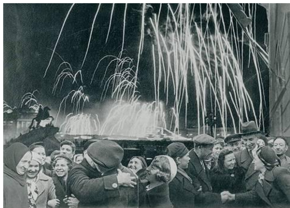
-Великая победа одержана советскими войсками под Ленинградом:

Победе радовалась вся страна, но эта радость была со слезами на глазах, так как в каждой семье, в каждом доме кто-то погиб на этой страшной войне.